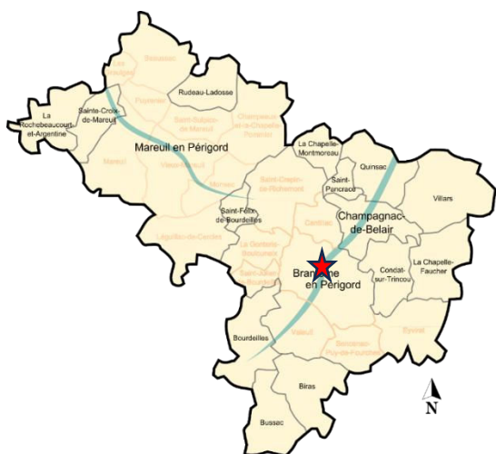
Carte du territoire de Dronne et Belle

Les parcelles concernées sont situées à Brantôme-en-Périgord, de la communauté de communes Dronne et Belle, dans le nord du département de la Dordogne, en région Nouvelle-Aquitaine. Elles font partie de la Zone d'Activité Economique (ZAE) de Font-Vendôme et portent un bâtiment de transformation agro-alimentaire de l'entreprise Bouffier et fils.