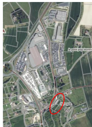
Vue aérienne de la ZAE de Font-Vendôme et