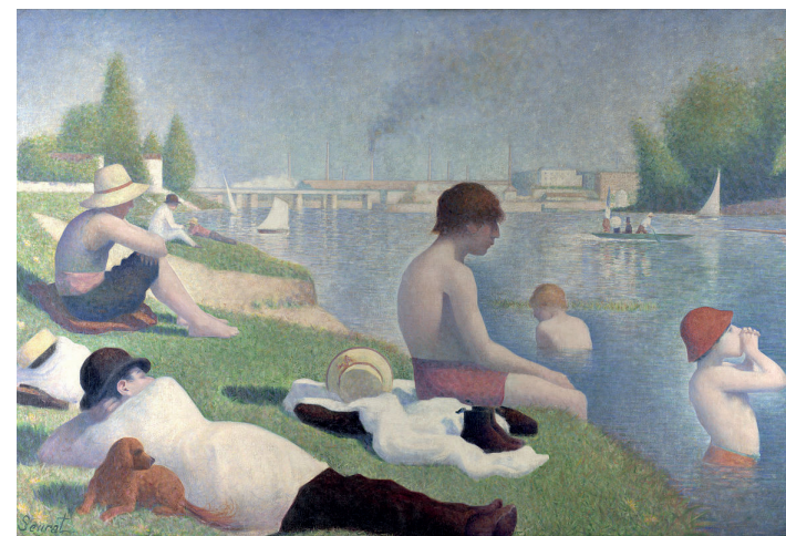
Une baignade à Asnières, Georges Seurat

Toutes les animations sont gratuites. Réservation conseillée. Micro-causerie = présentation et échange autour d'une oeuvre d'art.