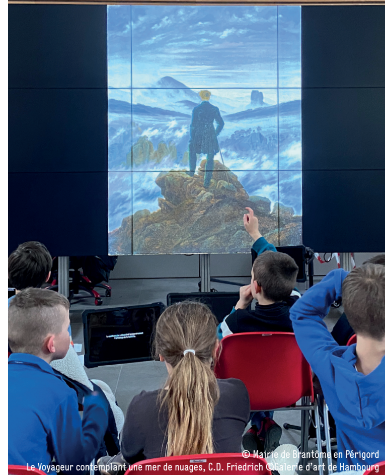
© Mairie de Brantôme en Périgord Le Voyageur contemplant une mer de nuages, C.D. Friedrich ©Galerie d'art de Hambourg