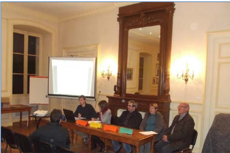
Réunion publique du 16 décembre 2013

En conclusion, la population et les acteurs locaux ont été informés de la procédure d'élaboration d'une AVAP sur la vallée de la Dronne entre Brantôme et Bourdeilles. La démarche a été accueillie favorablement par les habitants sensibles à la qualité de leur cadre de vie et à sa préservation.