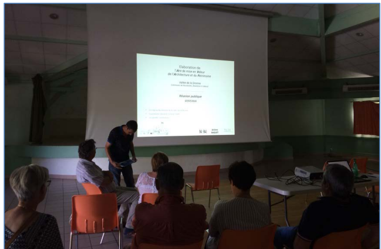
Réunion publique du 7 juillet 2016