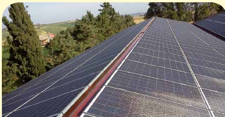
Exemple de toiture photovoltaïque prévue à Brantôme